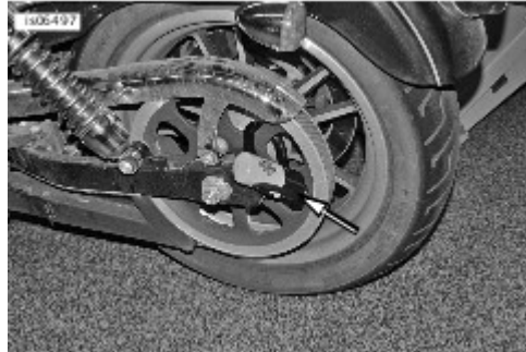
図1。ブレーキディスク装着図(スプロケット装着に類似)